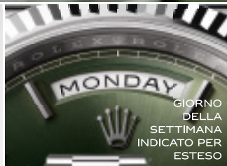
GIORNO DELLA SETTIMANA INDICATO PER ESTESO